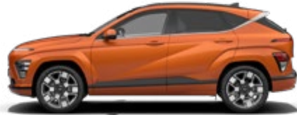
Jupiter Orange Metallic