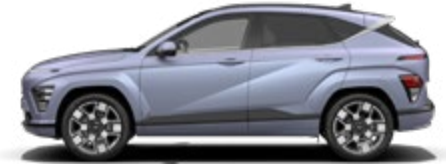
Meta Blue Pearl