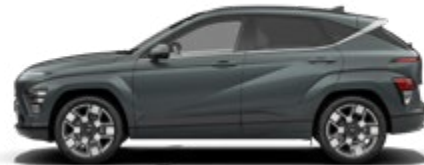
Cypress Green Pearl