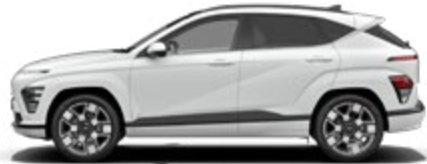
Serenity White Pearl