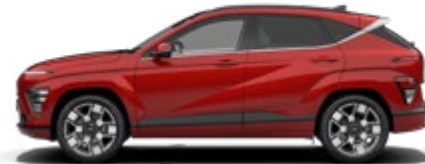
Ultimate Red Metallic