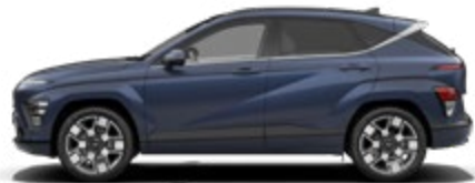
Sailing Blue Pearl