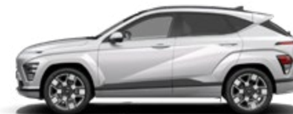
Shimmering Silver Metallic