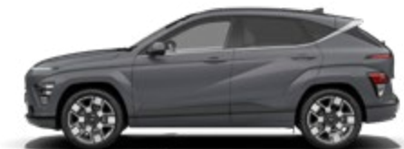
Ecotronic Gray Pearl