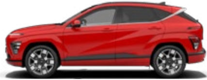
Engine Red Solid