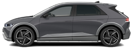
Ecotronic Gray Pearl