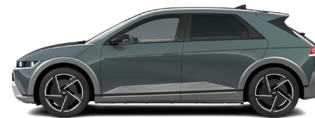
Digital Teal-Green Pearl