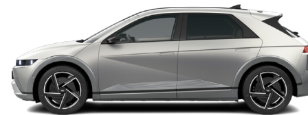
Gravity Gold Matte