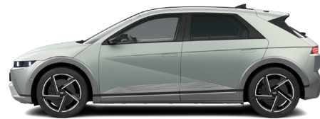
Celadon Gray Matte