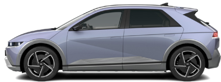
Meta Blue Pearl