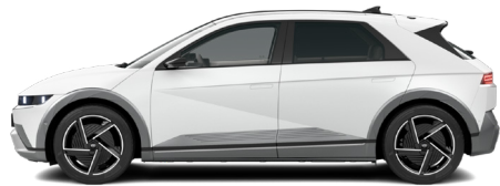
Atlas White Matte