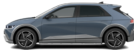
Lucid Blue Pearl