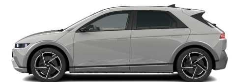
Cyber Gray Metallic