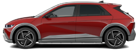
ohne Aufpreis Ultimate Red Metallic