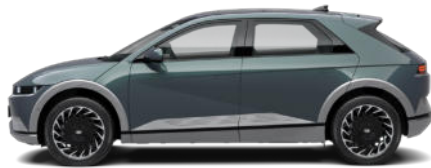
Digital Teal-Green Pearl