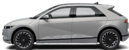
Gravity Gold Matte