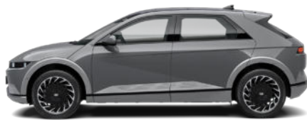
Galactic Gray Metallic