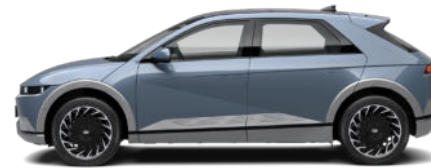
Lucid Blue Pearl