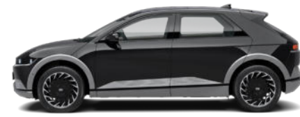
Phantom Black Pearl