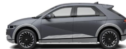
Shooting Star Gray Matte