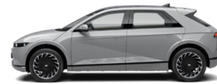
Cyber Gray Metallic